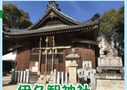
伊久智神社 (東浦町)