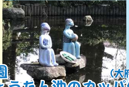
大倉公園 (大府市) ひょうたん池のカッパ像 開園時間 2月~4月 AM8:00~PM5:00 5月 AM8:00~PM6:30

パンケーキ & スコーン メイフェア MAYFAIR amcafe 東浦町森岡上半之木40-1 0562-84-5515 ◎ 9:00~17:00 (L.O.16:30) ☒ 月・火曜