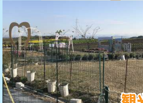
観光農園 花ひろば (南知多町)

南知多町内海場東55-1 0569-62-1937 Instagram @37cafe.37base ◎ 11:00~17:00 ☒ 月