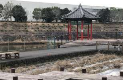
花かつみ園の花かつみ堂 (阿久比町)