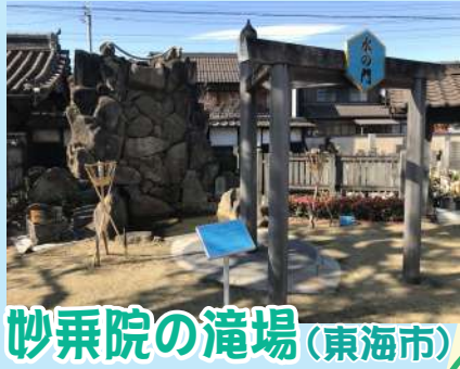
妙乗院の滝場 (東海市)