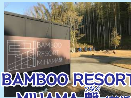
BAMBOO RESORT MIHAMA 繫 (美浜町)

なお、オススメスポット(★)でのパスポートと 一緒の写真(携帯可)は回収時にチェックします@