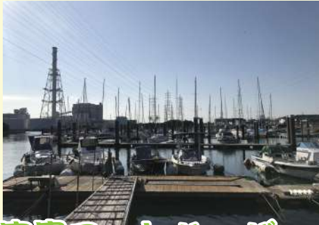
富貴ヨットハーバー (武豊町)

美浜町北方尾木毛36 080-5126-9616 Instagram @kaisyo44 ◎ 10:00~17:00 ☒ 火曜