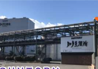
SUNTORY 知多蒸留所 (知多市) ※関係者以外立入禁止

知多市八幡里之前40-1 0562-51-2176 Instagram @nikolabo2023 ◎ 11:00~17:00 ☒ 火曜・水曜 他不定休