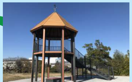
三丁公園の展望台 (東浦町)

阿久比町白沢天神裏2-11 0569-84-2221 Instagram @little.yummy.agui ◎ 11:00~16:00 (食材なくなり次第終了) ☒ 水曜