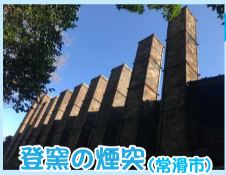
登窯の煙突 (常滑市)