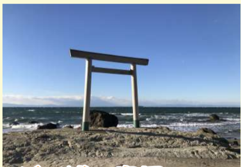
つぶて浦の鳥居 (南知多町)