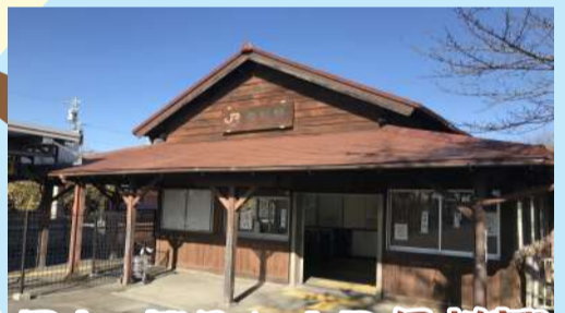
日本最古の駅舎★JR亀崎駅 (半田市)