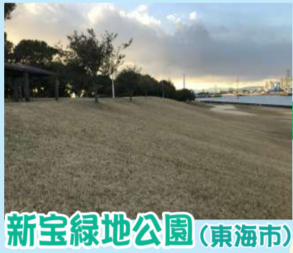
新宝緑地公園 (東海市)