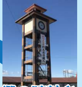
げんきの郷の時計台 (大府市)

東浦町生路池下61-11 (コノミヤさん敷地内) 0562-84-1655 Instagram @karari_higashiura ◎ 11:00~20:00 ☒ 第1火曜・毎週水曜