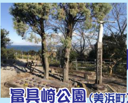
富具崎公園 (美浜町)