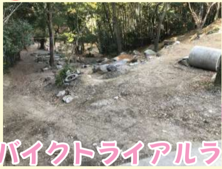
知多バイクトリアルランド (阿久比町)